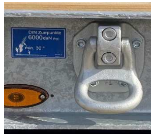
Schraubbare und nachrüstbare Zurringe