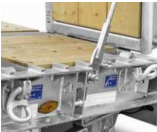
Kletterleisten am Außenrahmen im Bereich der Auffahrtsschräge