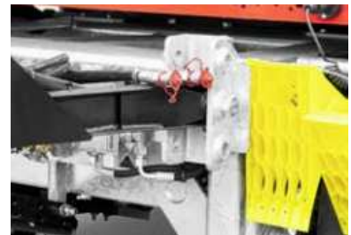
3 Lagerpositionen für die Zugdeichsel

*Sicherheitshinweis! Die Verwendung der Anhänger darf nur unter ausdrücklicher Beachtung aller straßenverkehrsrechtlichen, berufsgenossenschaftlichen und ladungssicherungstechnischen Vorschriften erfolgen. Alle Angaben ohne Gewähr! Für Irrtümer und Druckfehler wird keine Haftung übernommen. Technische Änderungen vorbehalten. Alle Maßangaben sind ca. Werte und beziehen sich auf das Serienfahrzeug ohne Zubehör. Zusatzausstattung verändert das Eigengewicht und die Nutzlast. Abbildungen ähnlich, können aufpreispflichtiges Zubehör enthalten.