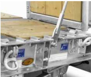
Kletterleisten am Außenrahmen im Bereich der Auffahrtsschräge