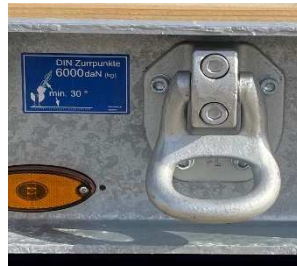
Schraubbare und nachrüstbare Zurringe